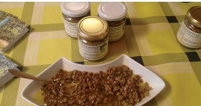
Production de pâté aux olives à partir de la réutilisation de grignons humides. La possibilité de produire des produits innovants réduit la gestion des déchets dans les huileries Andrea Pisanelli

de l'environnement local. L'industrie régionale d'huile d'olive regroupe environ 30 000 exploitations oléicoles couvrant environ 27 000 ha et comprenant 270 huileries. La phase de production de l'huile d'olive comprend l'extraction de l'huile et de sous-produits supplémentaires (eau, grignons et peaux). La gestion des sous-produits est très importante. Les déchets de l'huile d'olive ont un impact important sur les sols et les eaux, en raison de leur phytotoxicité élevée (phénols, lipides et acides organiques). D'autre part, ces déchets peuvent être potentiellement précieux.